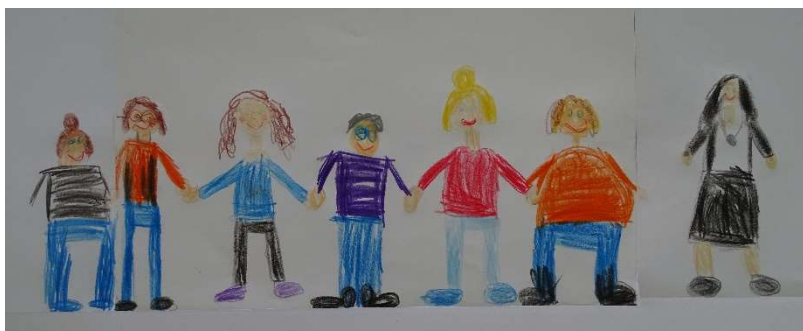
Unser aktuelles Team. Gemalt von den Kindern im Juni 2020.

Alle pädagogischen Mitarbeiter nehmen regelmäßig an verschiedenen Fortbildungen zur Verbesserung der eigenen beruflichen und persönlichen Kompetenzen und zur Weiterentwicklung der Einrichtung teil.