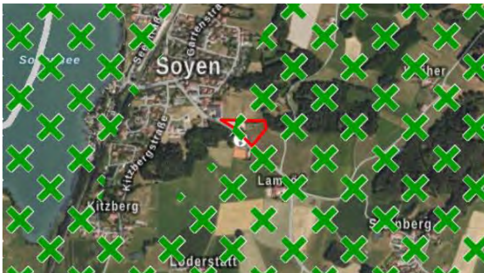
Abb. 4 Landschaftliches Vorbehaltsgebiet (grün gekreuzt)

Die Fläche liegt im Randbereich eines landschaftlichen Vorbehaltsgebiets. Schutzgebiete, Naturdenkmäler oder geschützte Landschaftsteile sind von der FNP-Änderung nicht betroffen.