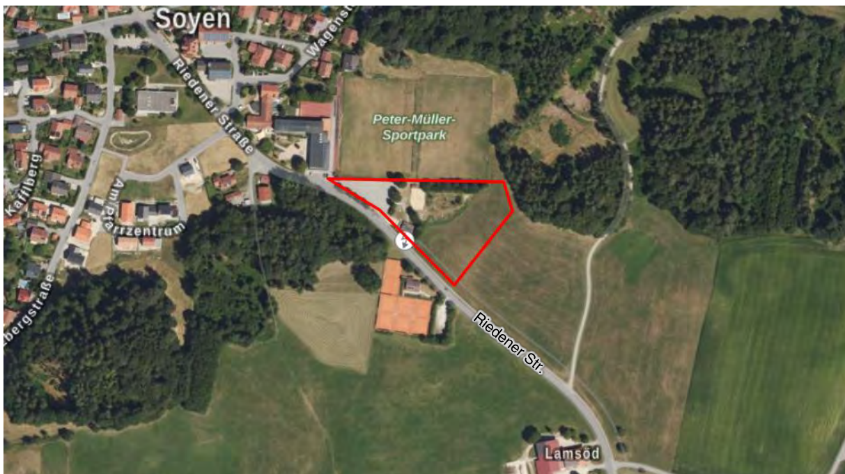
Abb. 1 Geltungsbereich der 18. Flächennutzungsplanänderung (rot), unmaßstäblich (Luftbild: Bayerische Vermessungsverwaltung 2023)

Die vorliegende Bauleitplanung umfasst die 18. Änderung des gemeinsamen Flächennutzungsplans (FNP) für den Raum Wasserburg a. Inn, Gemeindegebiet und Gemarkung Soyen, Bereich Riedener Straße Nordost. Durch die Änderung soll eine bestehende Fläche für Gemeinbedarf vergrößert werden (Peter-Müller-Sportpark). Dazu soll die bisherige Fläche für die Landwirtschaft als Fläche für den Gemeinbedarf für „sportlichen Zwecken dienende Gebäude und Einrichtungen“ ausgewiesen werden. Das Areal von ca. 1,1 ha liegt im Bereich der Flurstücke Nr. 263/7, 255 Tfl., 265 Tfl., 376 Tfl., 377 Tfl. Die insg. 1,1 ha umfassen ein Jugendfreizeitgelände (Volleyballplatz, Bikepark; ca. 0,2 ha), ein Parkplatz (ca. 0,2 ha), eine Intensivwiese (ca. 0,55 ha) und Gehölzbestände (ca. 0,15 ha). Nördlich des Geltungsbereichs liegen zwei Fußballplätze, nordwestlich die Grundschule der Gemeinde Soyen.