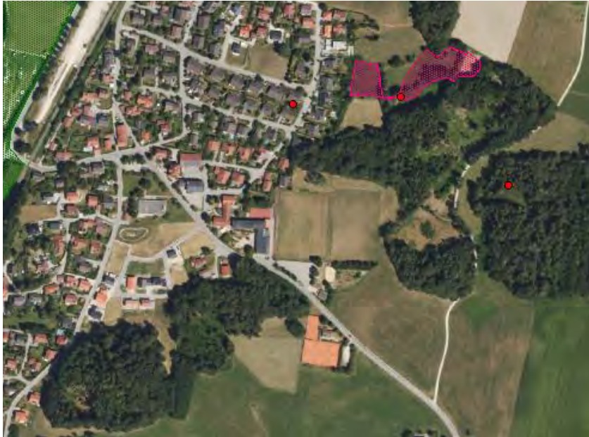
Abb. 3 Punkte der Artenschutzkartierung (1991-2007; rot) und Flachlandbiotopkartierung (2005; Fläche pink) (FIN Web, LfU, Stand 2023)