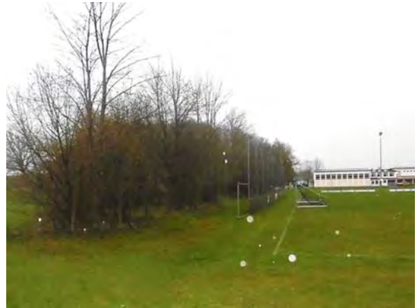
Abb. 8 Baumreihe entlang nördl. Grenze des Geltungsbereichs, Blickricht. Westen (30.03.23)