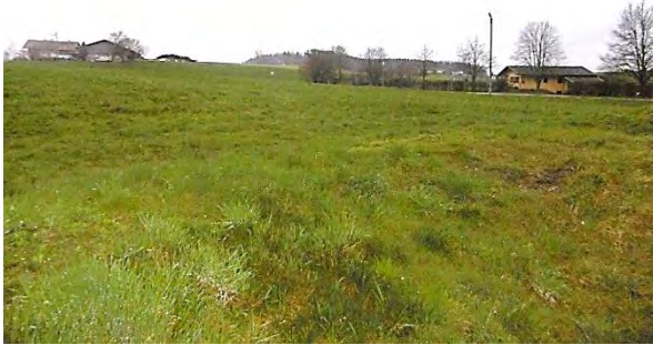
Abb. 5 Aussicht vom Bikepark-Gelände Richtung Lamsöd (Südost, 30.03.23)