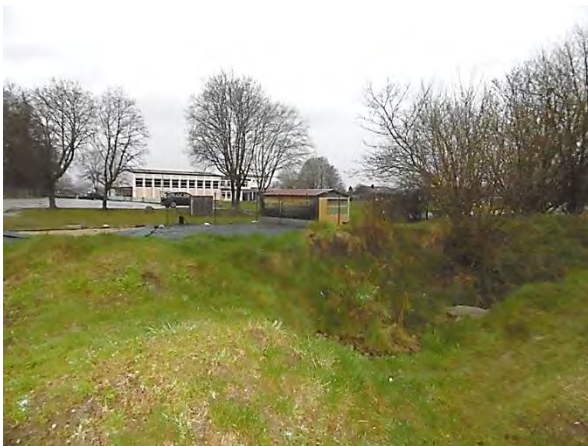
Abb. 9 Bikepark, Grundschule im Hintergrund, Blickricht. Westen (30.03.23)