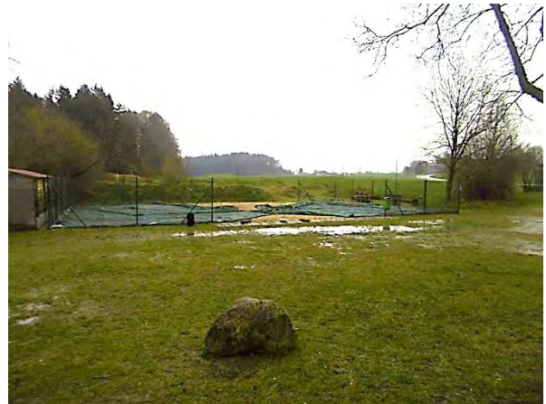
Abb. 6 Blick vom Parkplatz Richtung Osten (Volleyballplatz, 30.03.23)