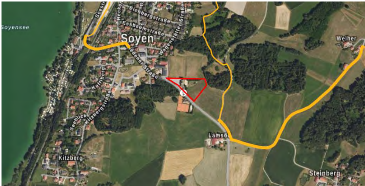
Abb. 10 Änderungsbereich (rot) mit örtlichem Wanderweg (gelb; unmaßstäblich)

Die Fläche liegt auf einer Höhe von ca. 493 m üNN und ist, unter Ausnahme des Bikepark-Geländes, nahezu eben. Bisher wird die Fläche als Freizeitgelände, Parkplatz und z.T. als Intensivgrünland genutzt (Abb. 10). Die nähere Umgebung ist durch Sportflächen, die Riedener Straße und weitere landwirtschaftliche Flächen geprägt. Nahe der Änderungsfläche verläuft ein örtlicher Wanderweg, ausgeschriebene Radwege befinden sich nicht vor Ort.