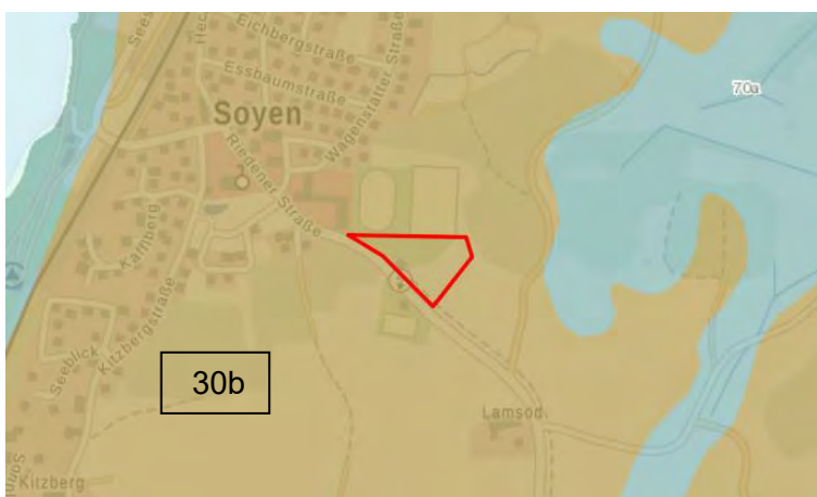
Abb. 11 Übersichtsbodenkarte 1:25.000 mit Vorhabensgebiet (rot; Bay. Vermessungsverwaltung)

Der Boden im Änderungsbereich setzt sich v.a. aus Braunerde, gering verbreitet Parabraunerde aus kiesführendem Lehm, über Schluff- bis Lehmkies zusammen (Abb. 11). Es handelt sich bereichsweise um humose Böden. Diese Bodenform besitzt eine hohe Nährstoffverfügbarkeit sowie ein mittleres Potential als Wasserspeicher. Bodendenkmäler und Geotope sind nicht von der Planung betroffen.