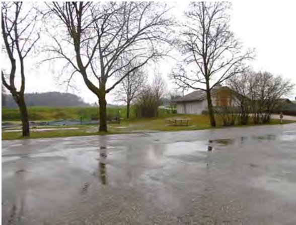
Abb. 7 Blick vom Parkplatz Richtung Südost mit Vereinsheim (30.03.23)