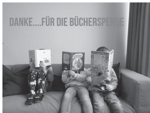
Der Kindergarten Schatztruhe hat sich mit Hilfe der Christbaumaktion 2020 neue Bücher gekauft.