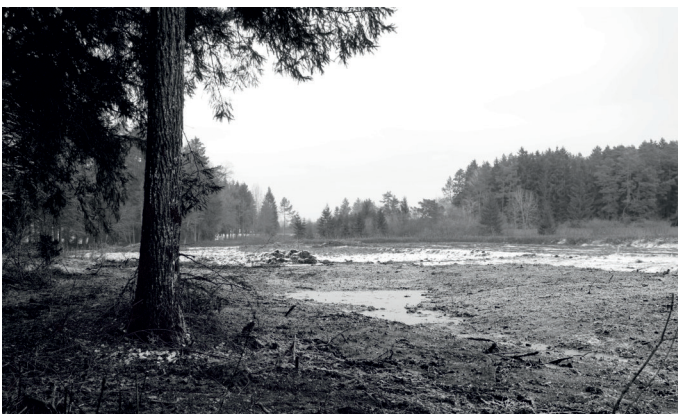
Angelegte Kleingewässer für Frösche und die Ringelnatter