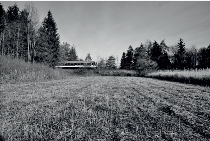
Gemähte Streuwiese im Schmidmoos