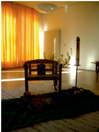
Foto von der Andacht 2019