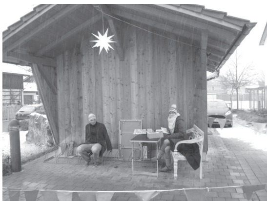
Der Kartenverkaufsstand vor dem Kindergarten .

Ein herzliches Dankeschön an alle Unterstützer und vor allem an die Firma Grafik Wagner mit ihren fleißigen Helfern im Hintergrund.